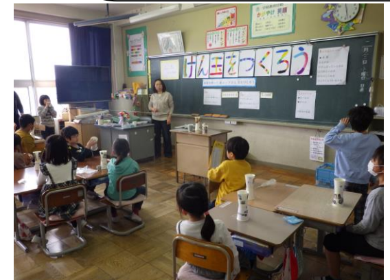
【NIE「紙コップけん玉をつくろう」】