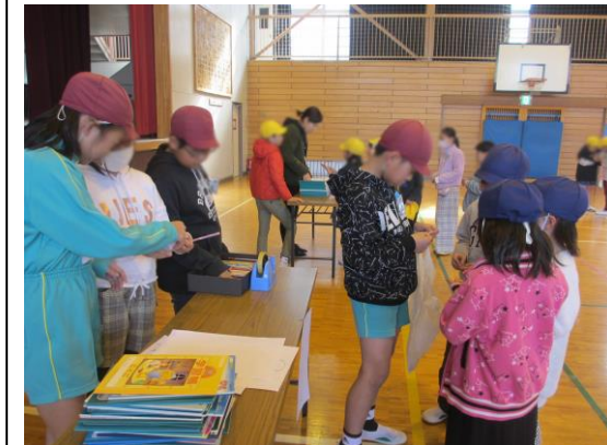
【2月12日 スペシャルベルマーク回収】